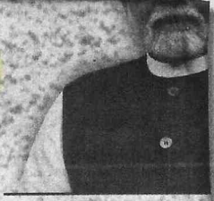
Narendra Modi, Pri

Whilst care is taken prior to acceptance of advertising copy, it is not possible to verify its contents. The Indian Express (P) Limited cannot be held responsible for such contents, nor for any loss or damage incurred as a result of transactions with companies, associations or individuals advertising in its newspapers or Publications. We therefore recommend that readers make necessary inquiries before sending any monies or entering into any agreements with advertisers or otherwise acting on an advertisement in any manner whatsoever.